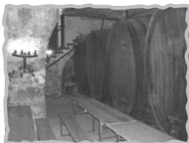
Cantina - Keller