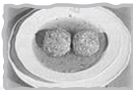
Canederli - Knödel

Cornaiano - Girlan Via Casa del Gesù 19 Jesuheimstraße Tel. 0471 665585 - Fax 0471 7531182