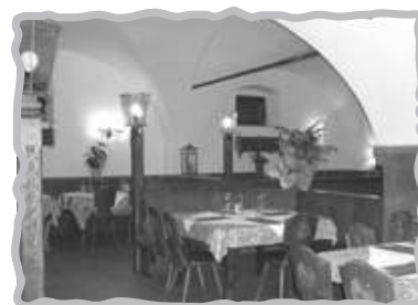
Sala - Speisesaal