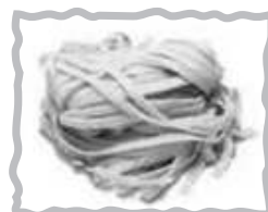
Pasta fresca Hausgemachte Nudeln