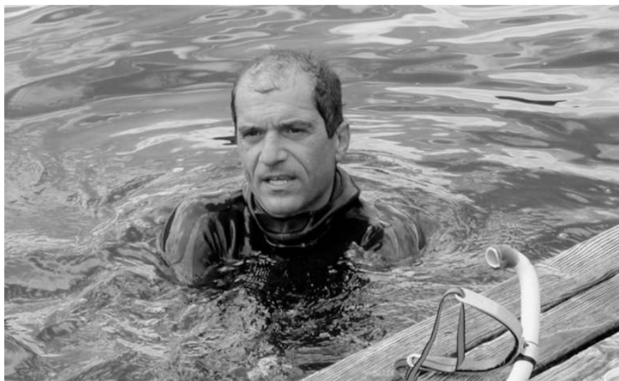
Gara di nuoto al lago grande di Monticolo